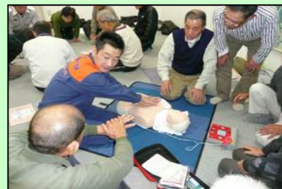
講習会の様子です

自治会館にAEDが設置された時期とほぼ同じく開始し、昨年の暮れには第4回の講習会を開催しました。この講習会は交野市消防本部のアドバイスで2年に1回実施しております。この講習会の重要性を認識し、心肺停止の方が居られる場面に遭遇した時には速やかに対応でき、いつでもAEDを使用できるように今後も講習会を開催し受講していきたいと思っております。