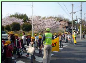
学童の登下校の安全を見守っています

学童の登下校の見守りを始めて8年になります。新聞紙上では、これまでも登下校の子供たちが巻き込まれる交通事故や事件が後を絶ちません。交通ルールやマナーを子供たちに指導すると同時に、事故や事件から子供たちを守るボランティア活動が期待されています。学童見守り活動の中では「挨拶運動」も同時に展開されており、当初声を掛けても返事が返って来ない子供たちも最近では子供の方から元気な声で挨拶が聞かれます。