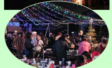
点灯式と点灯状況