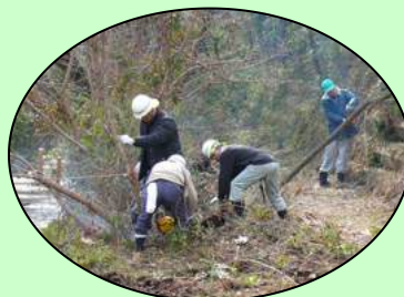
雑木を掘り起こして整備を進めました