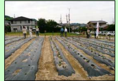
整地後の状況です

2008年の4月、人の背丈もある雑草と雑草で見えなかった不法投棄品、掘り返せば出て来る大きい石やコンクリートの塊を除去しながら重機を借りて開墾・整地を行いました。荒地は今では「花と緑の和み広場」に变身し、四季の花々、綿の栽培など地域の方々の和みの場所になっています。また隣接するイベント広場では夏は「盆踊り&夏まつり」、秋は「コスモスまつり」、暮れは「山ナリエの駐車場」に、冬は「どんど焼き」に利用されその間はちびっ子や大人たちの野球の練習場として利用されています。さらに最近では「グランドゴルフ」のコートにも利用されています。1年を通して星田山手のボランティア活動が活発に行われるのはこのイベント広場・和み広場を貸してくださっている地主さまに感謝すると同時に活動し易いように荒地をこのような広場に開墾整地できたのはボランティアメンバーの熱意のたまものだと思います。今後もこの広場を大いに利用させて頂き地域の生活に貢献できる活動をしたいものです。