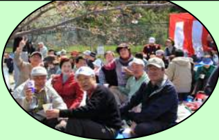
大いに盛り上がっています

今年(2017年)で10回目になる傍示川花見大会も年々参加者が増えて、皆さんの楽しみの一つになっているようです。特別なアトラクションがあるわけでもありませんが、春の一日久し振りに出会う方との交流が非常に大事であると思います。僅かな時間ですが親睦を深めるために利用して頂きたいと思います。