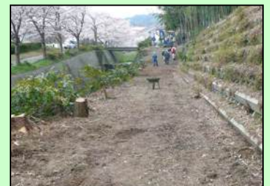
整備後の傍示川・右側が整備場所

和み広場の整備に先立つ同年の2月、傍示川の右岸(川下より見て)はニセアカシアを始めとする雑木で覆われ人々を寄せ付けませんでした。数十メートルもある背の高い木や大きく張った根を除去するのは簡単ではありませんでした。何日もかけ皆さんの協力でやっと道らしく整備され、桜も植樹され木も大きくなり、花も立派になりました。ベンチもおかれ遊歩道として多くの方に喜ばれています。桜の木が新しいので最近では交野市内でもっともきれいな桜並木ではないかと言われています。この傍示川遊歩道を整備したことにより花見大会も多くの参加者を迎えて実施することが出来ています。そしてこの遊歩道をいつまでもきれいに維持していきたいと思えます。