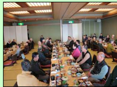
昼食会の風景です

今年で第7回になるバスツアーは毎年2月頃に実施しておりボランティアグループ主催ではありますがどなたでも参加して頂いています。温泉に入ってゆっくり懇親を深めて頂く良い機会であり、また行き帰りには日頃行けない所の見学やバス車内でのクイズ、全員での合唱等お互い昔に還ったような気分で楽しんで頂いています。