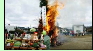
もちつき・神事・点火の様子です