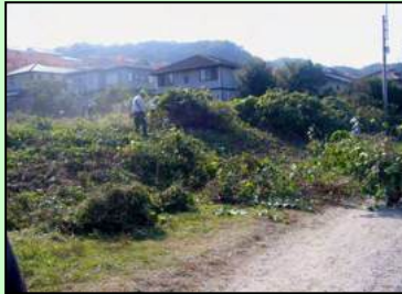
開墾前の状況です