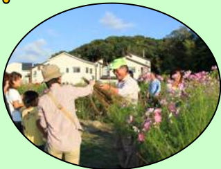
コスモスの花をお持ち帰り頂きました

コスモスの花がほぼ満開になる10月初旬、イベント広場でコスモスまつりが開かれます。2016年で9回目になりましたが約300名の方が参加頂きました。今回もボランティア名物の芋煮汁も無料で振る舞われました。飲物で歓談して頂き、またコスモス畑を散策して頂くのも楽しいものです。コスモスまつり以後は和み広場のコスモスは自由にお持ち帰り頂けます。