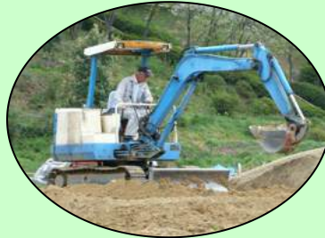
重機を入れて整備しました