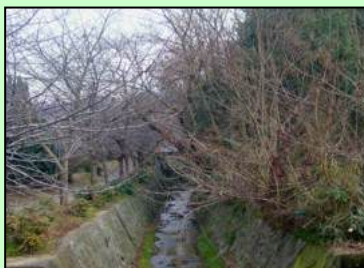
整備前の傍示川・右側が整備予定場所