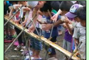
夏場のソーメンはおいしい!

2014年までに10回の「ソーメン流し大会」を実施しましたが場所の都合で2015年から中止になりました。夏の盛りにおける一服の涼感を味わえる行事ではなかったかと思えます。近隣の地域ではめったにない行事として最近では地域外からの参加者も多かったようです。子供たちの夏の思い出の一つとして十分に楽しんで頂きました。