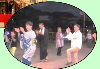
夜遅くまで盆踊りが続きました