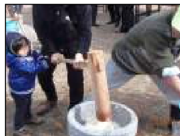
ちびっ子も参加しての餅つき

従来自治会行事から完全にボランティアの行事に移行されて2回目の開催になります。今回も正午からちびっこ向けの餅つき大会、それが終わってから「どんど焼き」の神事、点火へと実施されました。少し風が強くやや心配もされましたが大した影響もなく無事終了致しました。