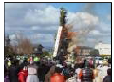
点火直後のどんど

例年のことながら乾杯の後の懇親会では同じ地域で居住しながら久しぶりにお会いする方も多くおられます。星田山手は色々な行事が多いといわれますが、これら行事をきっかけに地域の方々に常日頃から接触する機会を提供できればよいと思っております。今後も多くの方々の参加をお待ちしています。