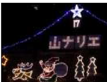
法面に設けられた回数を示すイルミネーション」