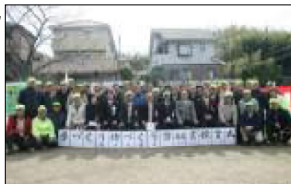
表彰式に参加した関係者とボランティアのメンバー