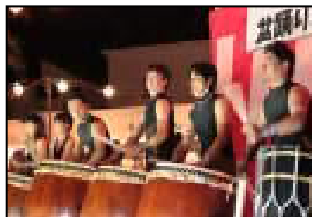
和太鼓は毎年迫力があります