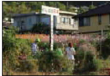
三々五々、コスモス畑を觀賞頂きました

秋真っ盛りの10月7日(日)に恒例の「コスモスまつり」が多くのご来賓の方をお迎えして「和み広場」で実施されました。大阪近辺への大きな被害は有りませんでした。今年と比較的台風が多く発生して、和み広場のコスモスもかなり倒れました。しかしながら和み広場の管理者を始めボランティアの皆様の努力によりコスモスを起こし、ロープで支えて何とかコスモスまつりを迎えることが出来ました。コスモスまつり当日は昨年と同じく約350人の参加者があり、ボランティア特製の芋煮汁や飲み物で懇親を深めて頂きました。またコスモスまつり終了と同時に和み広場のコスモスは自由に切り取ってお持ち帰り頂けることになっています。(10月30日(火)にコスモス畑の整理を行いますのでお早めどうぞ！)