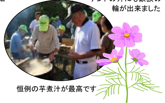
恒例の芋煮汁が最高です