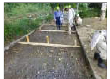
土留めを設けて補修しています