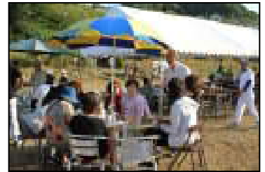
テントの外にも歓談の輪が出来ました