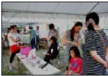
ちびっ子向けの美容室は大人気

交野市内でも盛大に実施する夏まつりとしてちょっと有名(?)になってきた星田山手の「盆踊り&夏まつり」も今年は大変なハプニングに襲われました。前日から準備して来た会場が当日の夕方から突如吹き荒れた強烈な突風により約10張りのテントは倒壊し、テントを支えていた骨組みは湾曲し、設置の終わっていた電気配線は随所で切断されて壊滅状態になりました。関係者を緊急招集して対策会議を行いました。最初は皆さん茫然として言葉もありませんでした。しかし気を取り直して善後策を協議し、取敢えず当日