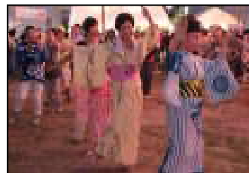
夜遅くまで踊りの輪が続きました

同時に我がボランティアグループの結束力の強さを改めて感じました。開催にご協力して頂いたボランティア及び地域内外の皆様、有難うございました。来年もまた頑張りましょう！