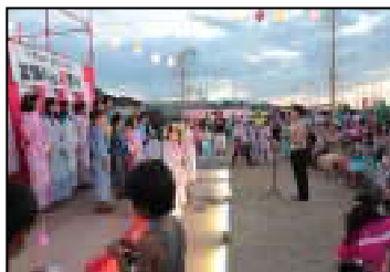
ちびっ子達の綺麗な合唱です

の開催延期の地域内広報、折れ曲がったテントの骨組みの突貫の修理など夜遅くまで対応して、やっと翌日の開催にこぎ着けました。順延のために当初予定しておりました三中の吹奏楽演奏は中止になりましたが、代わりに有志の方のバイオリン演奏をお願い致しました。他にちびっ子たちの合唱や、今回は都合で和太鼓はサスケに演奏をお願いしていましたが昨年までの奏者の方も飛び入りで協力して頂くなど、本番では大いに盛り上がりました。また今回の模擬店の中にはちびっ子向けの美容室が初めて開催され非常に好評でした。今回の突風によるハプニングに関しましてボランティア会員の隠れた技能や、修理の設備を提供して頂いた地域の方に感謝すると