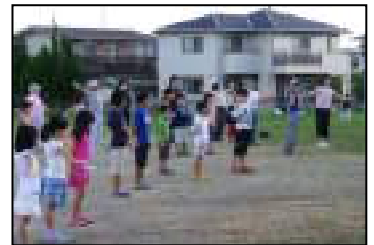
ラジオに合わせて伸び伸びと

今年も子供会のラジオ体操がイベント広場で実施されました。8月16日(木)から24日(金)までの7日間(土、日は休み)でしたが大人、子供合わせて約670名の方が参加頂きました。1日当たりの参加者は約95人と昨年度より若干減ってはいますが毎年100人前後の方が参加して頂いています。また山手地域の近くでもあちこちでラジオ体操のサークルが出来ているように聞きます。朝の清々しい時に新鮮な空気を吸ってその日のスタートを切るのは非常に健康的で良いことだと思います。(下記にもサークル案内を掲載しています)