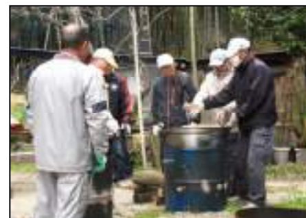
恒例になった「男の料理」で豚汁を作っています