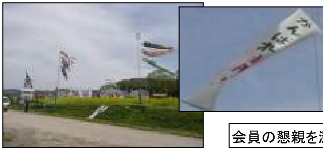
泳ぎ出した鯉のぼりと垂れ幕

日頃は何時ボランティア活動で忙しく、力仕事でご協力頂いているボランティア会員の皆様方お互いの懇親をさらに深めるために、初めての企画ではありますが日帰りバス旅行を実施しました。行き先は湯の山温泉(昼食)～御在所岳～なばなの里で、参加頂いた方々は大いに楽しんで頂いたものと思います。