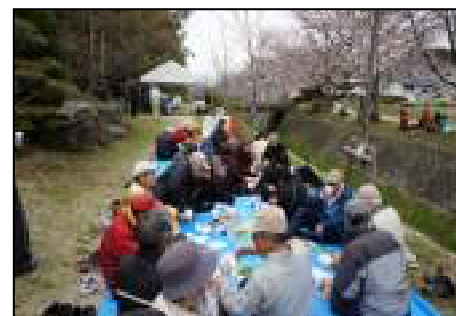
やや肌寒い花見でした

参加頂きました。当日は花冷えと云うかやや肌寒い日でしたので特製の「豚汁」が大変好評でした。会場では、花見といえども東日本では大変な生活を強いられておられる方々を思い義援金の募金箱を設置し参加者に協力をお願いしました。集まった義援金(73,158円)は早速区長の方から市役所の方へ届けて頂きました。