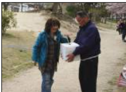
東日本大震災の義援金に協力頂いています