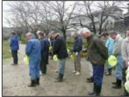
作業の前に、東日本大震災で犠牲になられた方々へ黙祷を捧げました

今年は冬が長く寒かったせいで雑草の成長も昨年に比べてかなり遅く、通常の部分は刈込ではなく引き抜き作業をすることになりました。しかし傍示川の川上ではこれまで手を加えなかった部分を今回初めて刈込をすると写真のような不法投棄品が次々と出てきて作業者を驚かせました。