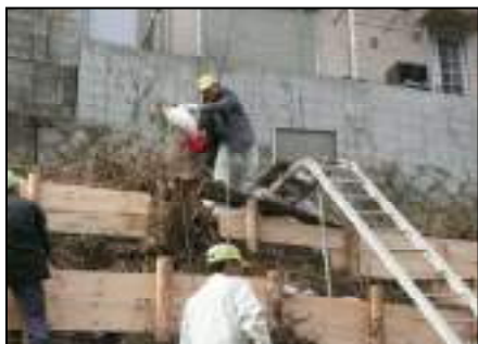
法面に土嚢を積み上げています