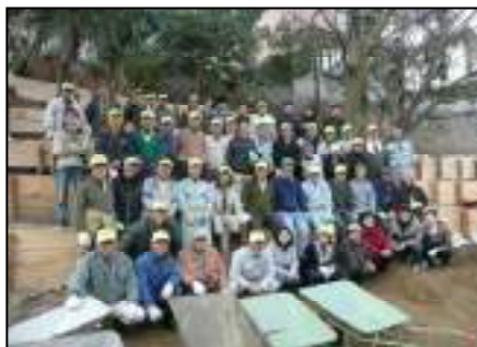
補強工事に協力頂いた方々です

星田山手区内の星田山手東の傍示川に面する斜面で、がけ崩れが何時発生するかわからない部分に大阪府と共同で補修工事を行いました。写真のように斜面に木杭を打ち込み板を縦に当込んで土嚢を積み上げるものです。下から住居部分まで5段設置され、ボランティアと東自治会で3~5段の部分の土嚢を積み上げる作業をしました。