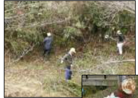
傍示川の川上の清掃と出てきた不法投棄品