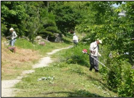
傍示川遊歩道の草刈りをしました

去る6月1日(火)の梅雨の時期に入る前に2回目の傍示川の草刈り・清掃を実施しました。前回の実施時より2か月以上も経っていますので草の方も結構大きく伸びており、草刈り機も全数フル稼働で行いました。今年は近くの奥田造園さんのご協力もあり、紫陽花、コスモスも植えられており、紫陽花は今の時期、コスモスはこれから秋に向けてだんだんと花を付けて通る人々の目を癒してくれるものと思います。これからも傍示川の紫陽花を増やして行こうと思いますので、もしご家庭に寄付して頂ける紫陽花がありましたらご提供を宜しくお願い致します。