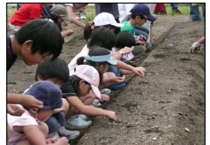
綿の種を丁寧に蒔いています

6月6日(日)午後、「和み広場」の一角に、今年も子供会のちびっ子たちの手で綿の種を植え付けました。畑の横のゲートボールのコートに集まったちびっ子たちは教育委員会の方や、ボランティア、花と緑の会の会員の方より「綿の種から河内木綿の出来るまで」の説明を受けた後、1列づつならんで綿の種を丁寧に蒔いて行きました。