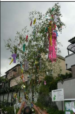
地域入口の笹飾り

7月7日の天の川七夕まつりに向けて、例年約1ヶ月前ぐらいから各地域では竹燈籠や笹飾りの製作に余念がありません。星田山手地域でも今年は例年と少し違った竹燈籠を作ろうということで試作もして検討してきました。