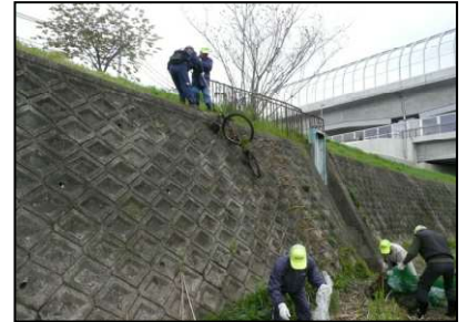
放置ゴミを川から引き揚げています

余り天気の良い日ではありませんでしたが20名弱のボランティア会員の皆さんの参加で4月24日(土)天の川の交野橋～逢合橋の担当区間の河原のごみを集めました。大きいものでは自転車や車のタイヤなどの不法投棄が目につきました。私たちの街の環境は私たちで守るために今後も積極的なご参加を宜しくお願い致します。