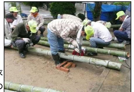
竹燈籠(文字燈籠)を製作しています

笹飾りも熟年会の会員の皆様のご協力で立派なエコ飾りや衣裳飾りを作って頂き、また子供会による短冊作成など、多くの方々のご協力で地域の入り口と自治会館に3本の笹飾りを飾り付けました。ところが当日の午後、突然の豪雨で天の川の水かさも増え、とうとう今年度の天の川七夕まつりは中止と云うことになりました。ここまで準備して頂いた方々や協力して頂いた方々は勿論のこと、参加予定して頂いた方には非常に残念でしたが、また来年目指して頑張りたいと思います！